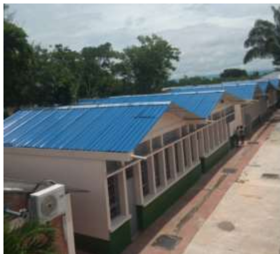
Foto 12. Mejoramiento de cubiertas

La presente evidencia se realizó por parte del área de bienes y servicios, en actividades de seguimiento a la inversión de recursos del FOME, así como de asistencia técnica solicitada por la I.E General Enrique Caicedo de Alvarado.