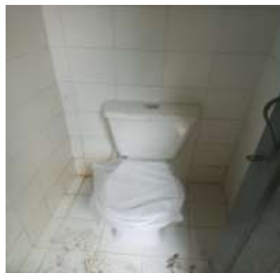
FOTO 5 Mantenimiento y mejoramiento de aulas Foto 6. Mejoramiento de baterías Sanitarias