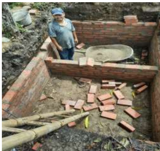
FOTO 11. mejoramiento unidades sanitarias

Recursos FOME Y FONDO EDUCATIVO (GRATUIDAD)