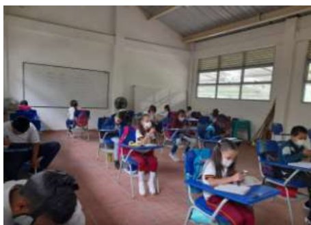
Foto 1. Mantenimiento y mejoramiento de aulas

Recursos FOME Y FONDO EDUCATIVO (GRATUIDAD)