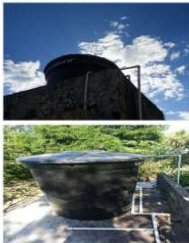
Foto 7. Mejoramiento de baterías Sanitarias