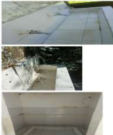
FOTO 9. MEJORAMIENTO UNIDADES SANITARIAS