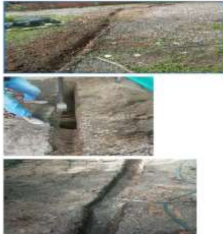
FOTO 8. mejoramiento baterías sanitarias