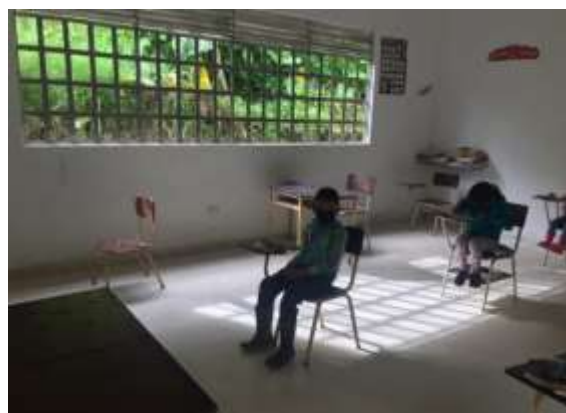
Foto 4. Mantenimiento y mejoramiento de aulas

Intervención: Mantenimiento y mejoramiento general (adecuaciones salones primaria) Avance: 100% - Ejecutor: I.E BILBAO Recursos FOME Y FONDO EDUCATIVO GRATUIDAD