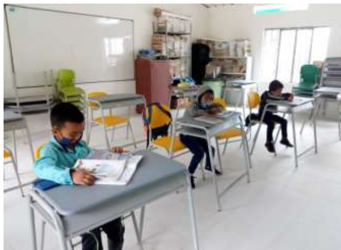
Foto 3. Mantenimiento y mejoramiento de aulas

Intervención: Mantenimiento y mejoramiento general (adecuaciones salones primaria) Avance: 100%- Ejecutor: I.E BILBAO Recursos FOME Y FONDO EDUCATIVO GRATUIDAD